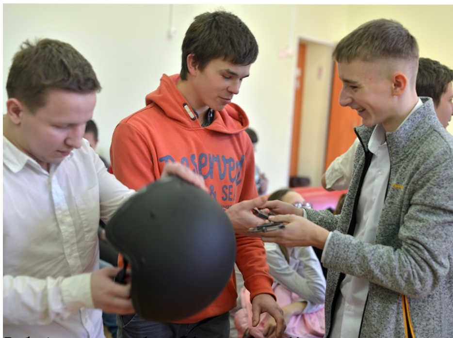
Бережливый труд — основа процветания. На фото — сотрудники вневедомственной охраны Управления Росгвардии по Томской области проводят проф